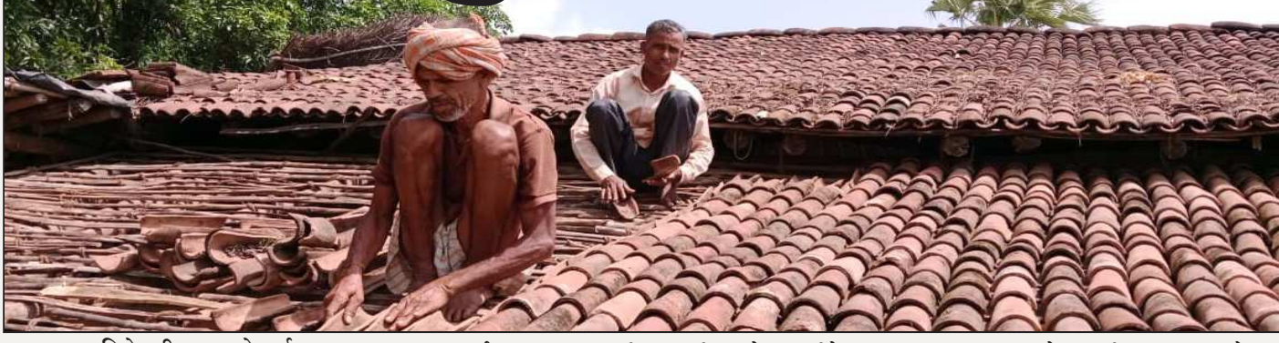
निळे प्रतीक न्यूज नेटवर्क मोलगी। प्रतिनिधी

सातपुड्याच्या ग्रामीण व दुर्गम भागातील घरे ही माती व लाकडापासून तयार होतात. अशा घरांचा वरती बांबूची चपटे असतात आणि त्यावर मातीचे कौल घरांची भिंत तयार करण्यासाठी बांबूच्या चापट्या पासून बनविलेले तट्टे (कुड) वापरण्यात येतात, आता यासाठी कापसाच्या काड्यांचा वापर देखील करण्यात येत आहे. त्यावर माती, शेणाने सारवले जाते आणि मग आकर्षक असे घर तयार होते.